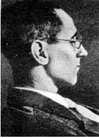
(10 फरवरी 1898—14 अगस्त 1956)