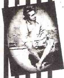
भारतीय इतिहास का एक दुर्लभ दस्तावेज